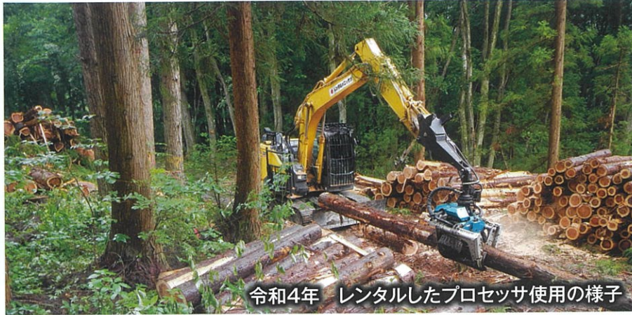
令和4年 レンタルしたプロセッサ使用の様子

当組合では、組合員の皆さまの有林を集約化し、皆伐再造林や間伐する事業を進めています。当組合所有の林業機械はグラップル付